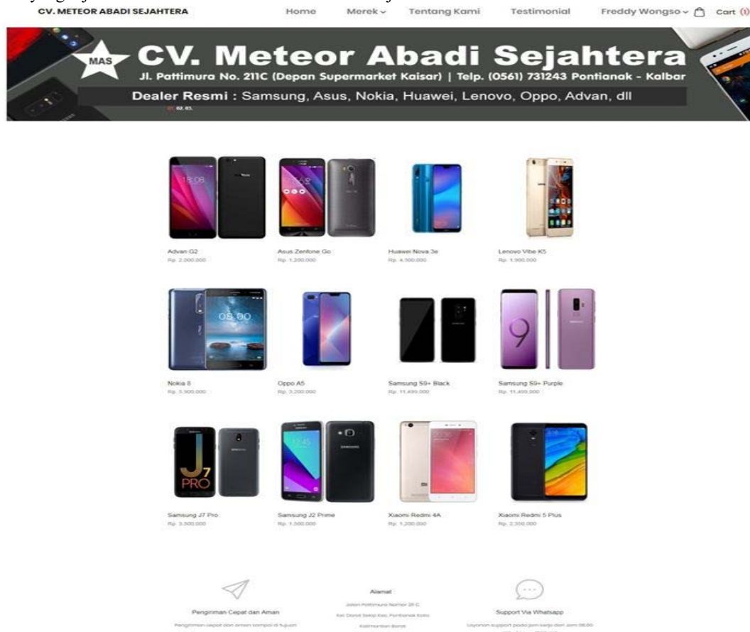
Gambar 5. Tampilan Halaman Utama

Halaman utama adalah halaman yang muncul ketika pelanggan berhasil melakukan login atau halaman yang pertama kali ditampilkan ketika pelanggan membuka alamat website . Di halaman utama ini terdapat menu, produk yang dijual serta alamat dari CV Meteor Abadi Sejahtera.