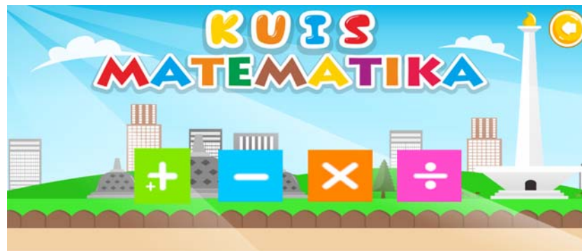
Gambar 4. Antarmuka Menu Operasi Perhitungan

Gambar 4 merupakan tampilan antar muka “Menu Operasi Perhitungan”. Pada tampilan menu operasi perhitungan hanya terjadi sedikit perubahan. Perubahan yang terjadi yakni penghilangan tombol play dan exit. Perubahan lainnya adalah penambahan tombol kembali, penjumlahan, pengurangan, perkalian, dan pembagian. Semua tombol yang baru digambarkan dengan simbol agar lebih menarik.