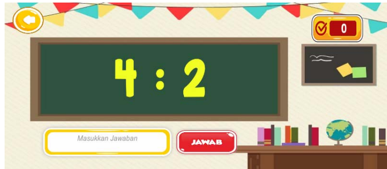
Gambar 9. Antarmuka Soal Pembagian

untuk kembali ke menu operasi perhitungan. Papan tulis berguna untuk menampilkan soal kuis. Textbox jawaban sebagai tempat untuk menuliskan jawaban soal kuis dan tombol jawaban berguna untuk mengecek jawaban apakah benar atau salah. Textbox skor berguna untuk memberitahu skor atau nilai yang didapat ketika menyelesaikan game tersebut.