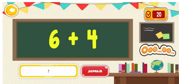
Gambar 6. Antarmuka Soal Jawaban Salah