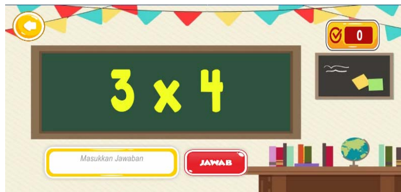
Gambar 8. Antarmuka Soal Perkalian

Gambar 8 menunjukkan tampilan antar muka soal perkalian. Tampilan soal kuis pada Gambar 8 terdapat tombol “Kembali” dan tombol “Jawab”. Pada Gambar 8 juga terdapat gambar papan tulis yang berisi soal, text box untuk menuliskan jawaban, dan textbox untuk menunjukkan skor. Tombol kembali berguna untuk kembali ke menu operasi perhitungan. Papan tulis berguna untuk menampilkan soal kuis. Textbox jawaban sebagai tempat untuk menuliskan jawaban soal kuis dan tombol jawaban berguna untuk mengecek jawaban apakah benar atau salah. Textbox skor berguna untuk memberitahu skor atau nilai yang didapat ketika menyelesaikan game tersebut.