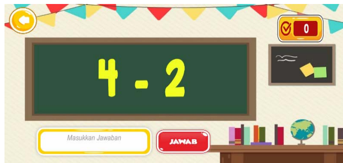
Gambar 7. Antarmuka Soal Pengurangan

Gambar 7 menunjukkan tampilan antar muka soal pengurangan. Tampilan soal kuis pada Gambar 7 terdapat tombol “Kembali” dan tombol “Jawab”. Pada Gambar 7 juga terdapat gambar papan tulis yang berisi soal, text box untuk menuliskan jawaban, dan textbox untuk menunjukkan skor. Tombol kembali berguna untuk kembali ke menu operasi perhitungan. Papan tulis berguna untuk menampilkan soal kuis. Textbox jawaban sebagai tempat untuk menuliskan jawaban soal kuis dan tombol jawaban berguna untuk mengecek jawaban apakah benar atau salah. Textbox skor berguna untuk memberitahu skor atau nilai yang didapat ketika menyelesaikan game tersebut.