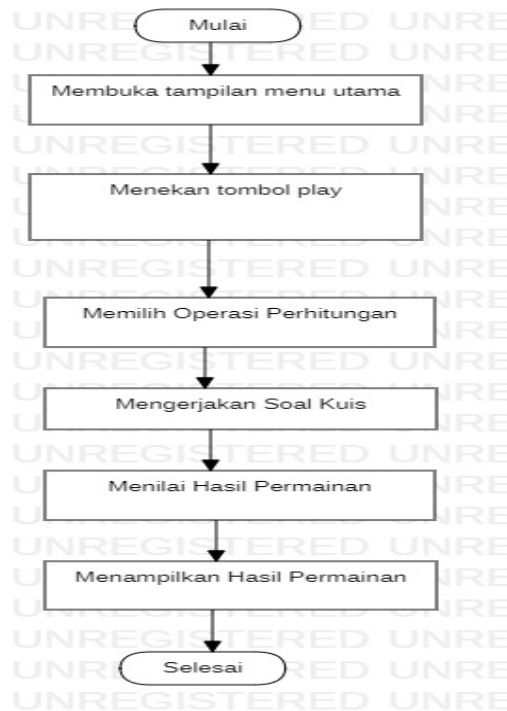
Gambar 2. Flowchart Aplikasi Pembelajaran Matematika

Gambar 2 menunjukkan flowchart aplikasi pembelajaran matematika. Aplikasi pembelajaran matematika mudah dimainkan dan sangat user friendly.