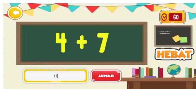
Gambar 5. Antarmuka Soal Jawaban Benar