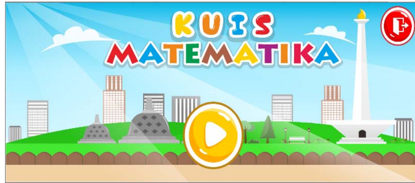
Gambar 3. Antarmuka Menu Utama

sebelumnya yakni Monas dan Candi Borobudur. Dengan semua hal tersebut tampilan antarmuka pada halaman menu utama diharapkan dapat menarik perhatian anak kelas 3 SD untuk memainkan game kuis matematika.